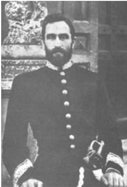
Sir Roger Casement. Su informe del Putumayo produjo la caída de la Peruvian Amazon Company.