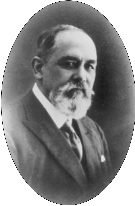
Julio César Arana, senador por Loreto, circa 1924.