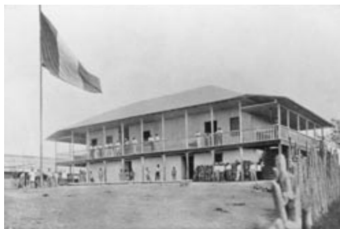
El Encanto, sección cauchera en el río Caraparaná.