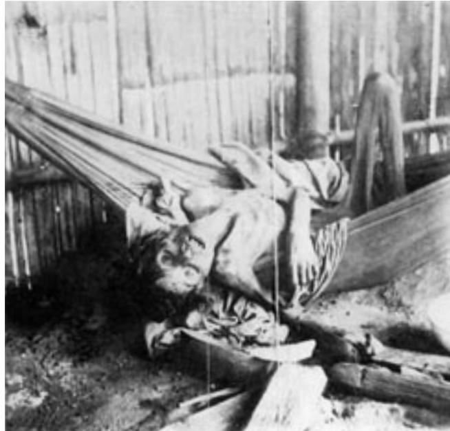
India de una sección cauchera, condenada a morir de inanición.