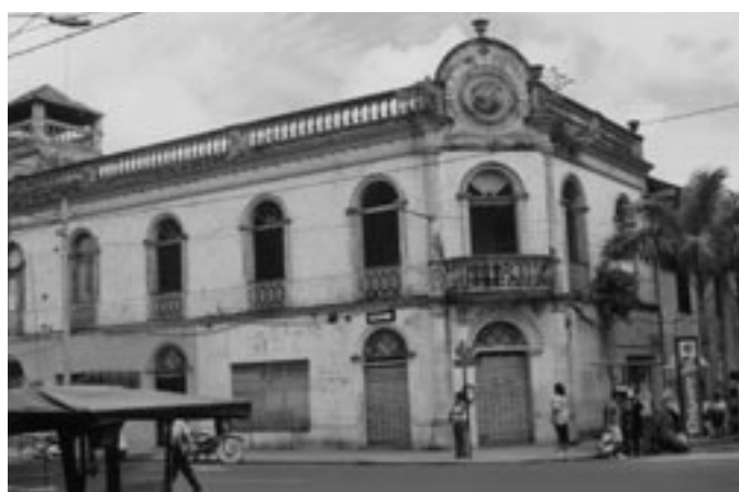
Casa comercial de los Morey, en Iquitos, en estado de abandono.