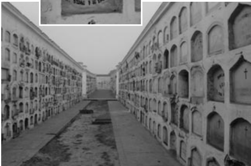
Cementerio Presbítero Maestro, en Lima, sector San Lázaro, donde se encuentra el paupérrimo nicho con lápida de cemento e inscripciones en pintura negra en el que descansan los restos del rey del caucho.