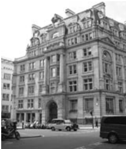
Salisbury House, en Londres, sede de la Peruvian Amazon Company.