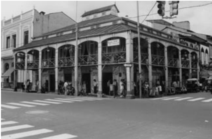
La casa Eiffel, en Iquitos, fue traída desde París hacia 1890.