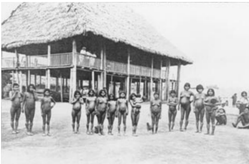
Indias de la etnia huitoto, preponderante en la región del imperio de Arana.

FUENTE: Norman Thomson, El libro rojo del Putumayo , Arboleda & Valencia, Bogotá, 1913.