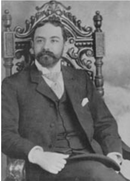
Julio César Arana a fines del siglo XIX.