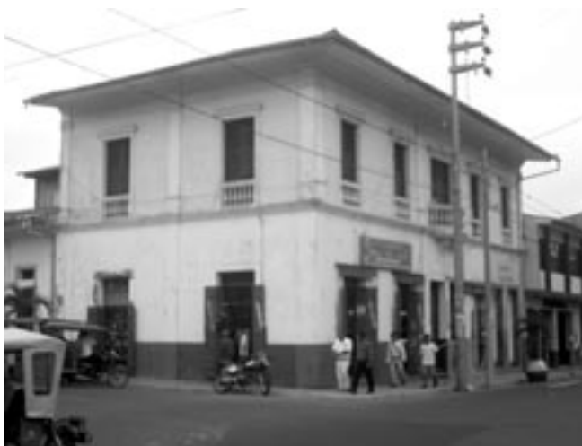
La casa de Julio César Arana en Iquitos, en la esquina de las calles Próspero y Omagua, hacia 1900.