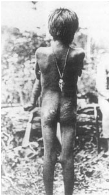
La "marca de Arana" en las nalgas de un niño.